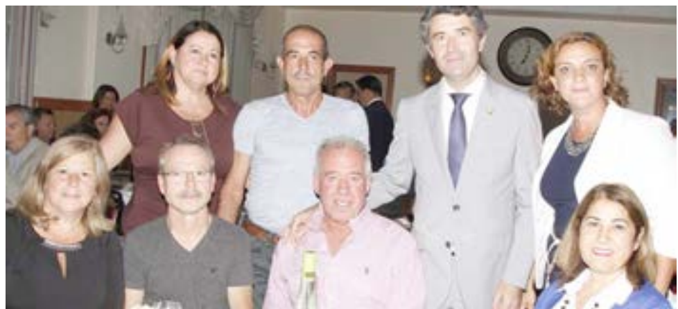
O secretário de Estado das Comunidades com a União Portuguesa Beneficente

consulares, para vos ajudar a fazer as candidaturas nas prioridades, para contarem com o apoio do estado português, para este trabalho, este esforço no associativismo”, concluiu José Luís Carneiro.