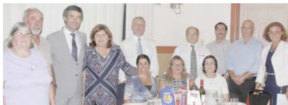
O secretário de Estado das Comunidades com o Centro Cultural de Santa Maria