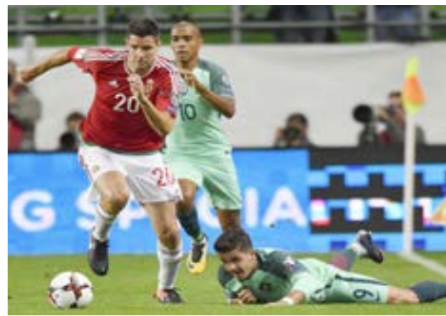
Cristiano Ronaldo. William Carvalho e Nélson Oliveira marcaram os restantes golos.

Recorde-se que Portugal havia ganho as Ilhas Faroé por 5-1, na passada quinta-feira, com um hat-trick de