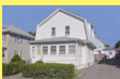
Colonial EAST PROVIDENCE $149.900