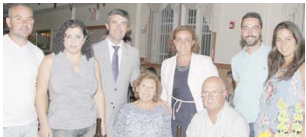
O secretário de Estado das Comunidades com o Bristol Sports Club