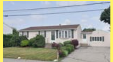
Ranch EAST PROVIDENCE $259.900