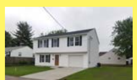
Colonial EAST PROVIDENCE $279.900