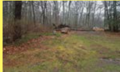
Terreno REHOBOTH $169.900