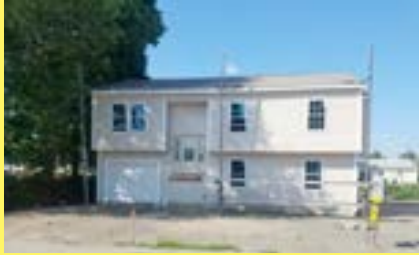
Raised Ranch EAST PROVIDENCE $279.900

• Várias casas à venda • Preços baixos • Juros continuam baixos