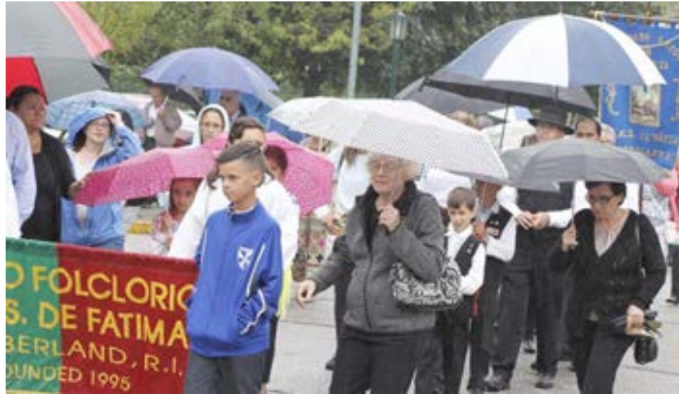
O rancho folclórico de Nossa Senhora de Fátima incorporou-se na procissão de domingo.