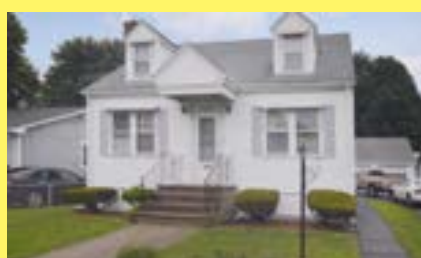
Cape EAST PROVIDENCE $219.900