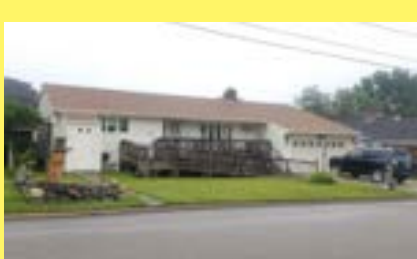
Ranch KENT HEIGHTS $319.900