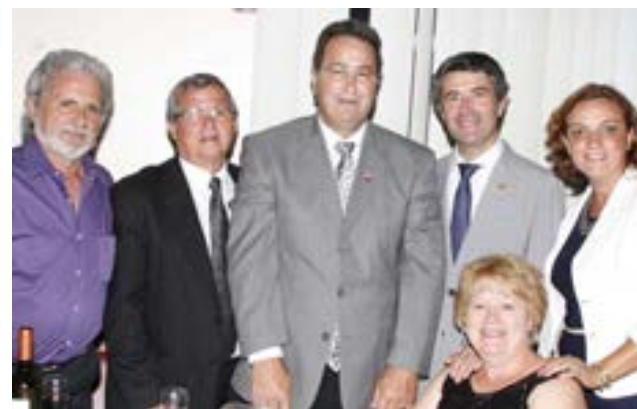
O secretário de Estado das Comunidades com a Irmandade do Bom Jesus e a Banda Nova Aliança.