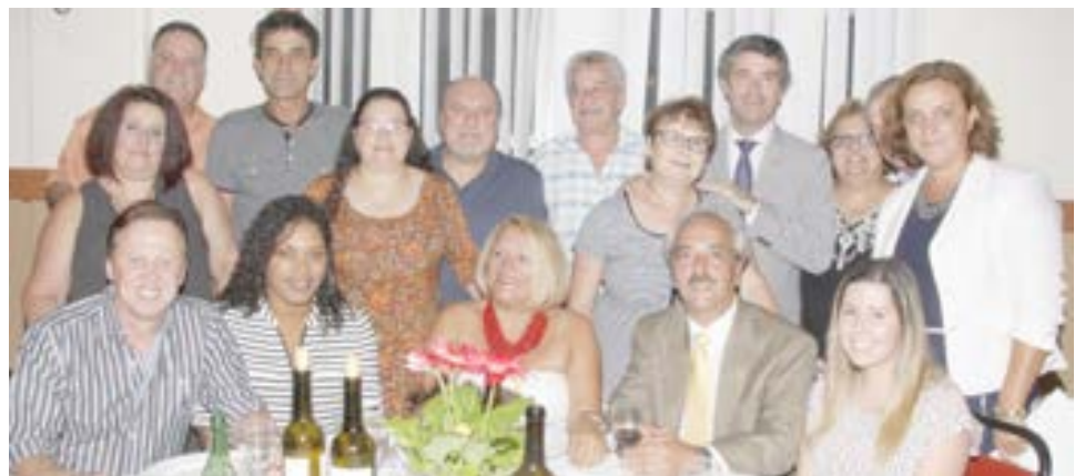
O secretário de Estado das Comunidades com o Clube Sport União Madeirense