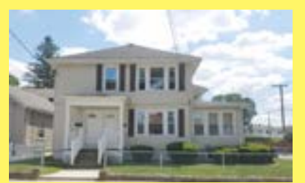
2 familias PAWTUCKET $259.900