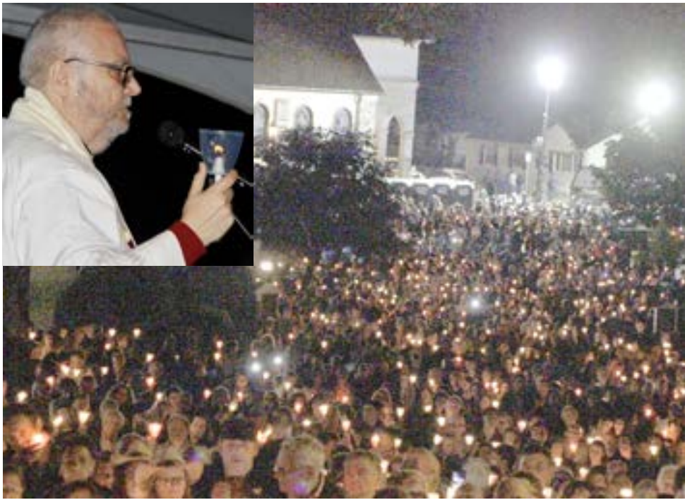
No Santuário de Fátima em Ludlow