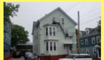
3 familias FOX POINT $439.900