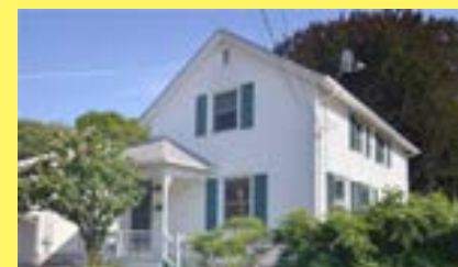
Cottage RIVERSIDE $199.900