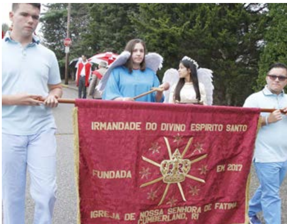
A recém formada Irmandade do Espírito Santo da paróquia de Nossa Senhora de Fátima em Cumberland também se incorporou na procissão.