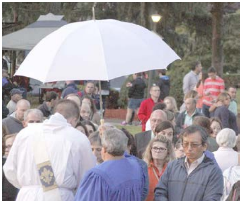
O momento da Sagrada Comunhão pelos fiéis, que vários padres distribuíram pelas largas centenas de pessoas que participaram na solene eucaristia.