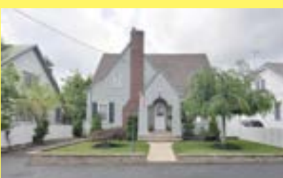
Cape WARWICK $270.000