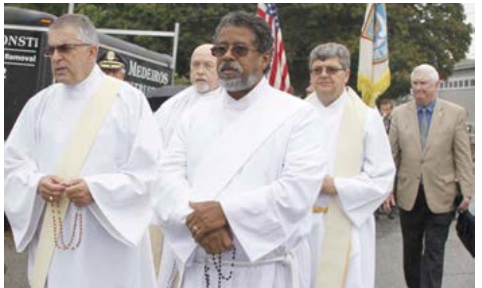
O clero que se incorporou na procissão de Nossa Senhora de Fátima, não obstante as más condições atmosféricas sentidas no passado domingo.

EXCURSÕES TEMÁTICAS — PASSEIOS COM GUIA — ATIVIDADES