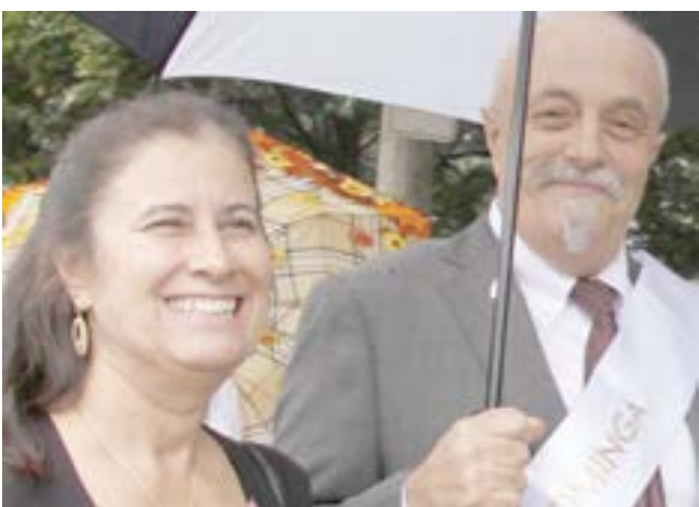
Na foto abaixo, elementos da Irmandade do Espírito Santo da igreja de Nossa Senhora de Fátima em Cumberland.