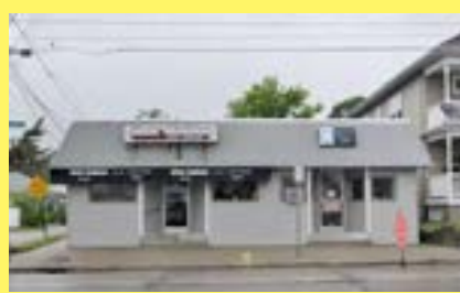
Commercial/Office EAST PROVIDENCE $159.900