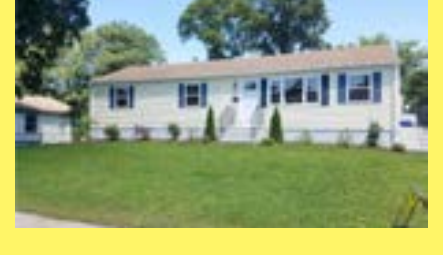
Ranch EAST PROVIDENCE $249.900