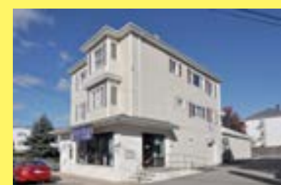
Comercial/2familias NORTH FALL RIVER $269.900