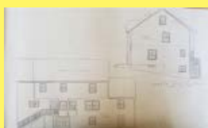
Colonial SEEKONK $574.900