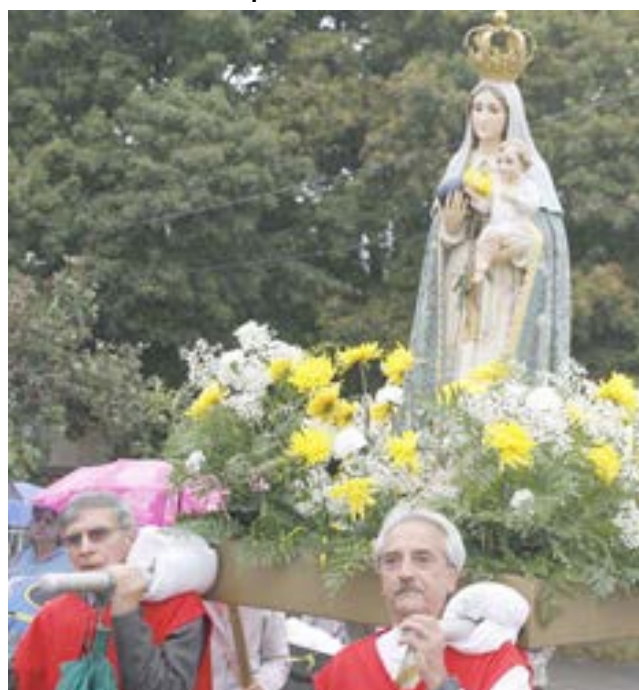
O andor com a imagem de Nossa Senhora do Monte transportado pelos associados do CSU Madeirense.

- A 24 de Junho de 1965 é lançada a primeira pedra do que viria a ser uma das mais bonitas e significativas igrejas portuguesas.