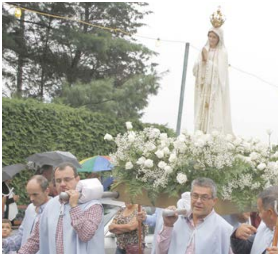
O andor com a imagem de Nossa Senhora de Fátima transportado pelos fiéis.

Não obstante a chuva que se fez sentir, a Banda Nova Aliança de Santo António de Pawtucket foi uma das que abrilhantou a procissão, cujo trajeto foi diminuído, face às adversas condições atmosféricas.