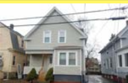
Cottage CRANSTON $159.900