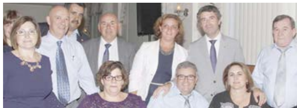
O secretário de Estado das Comunidades com o Cranston Portuguese Club