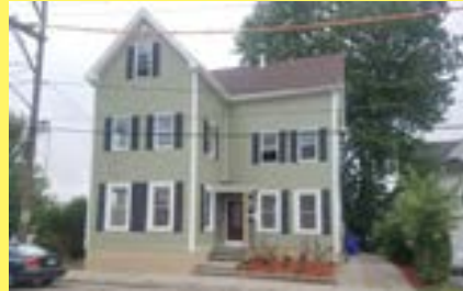
2 familias EAST PROVIDENCE $299.900