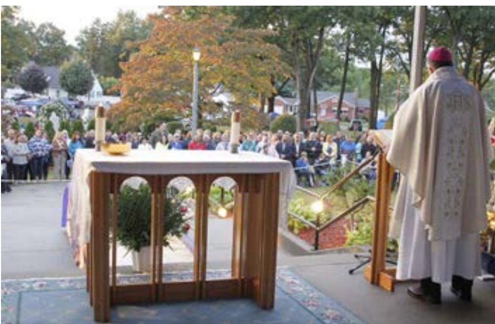
O bispo de Springfield durante a homilia.