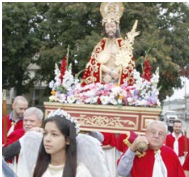
O andor com a imagem do Senhor Santo Cristo.