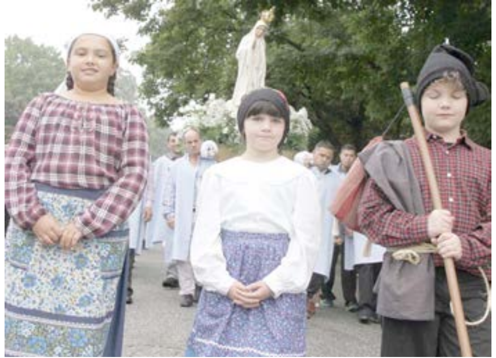
Na igreja de Nossa Senhora de Fátima em Cumberland