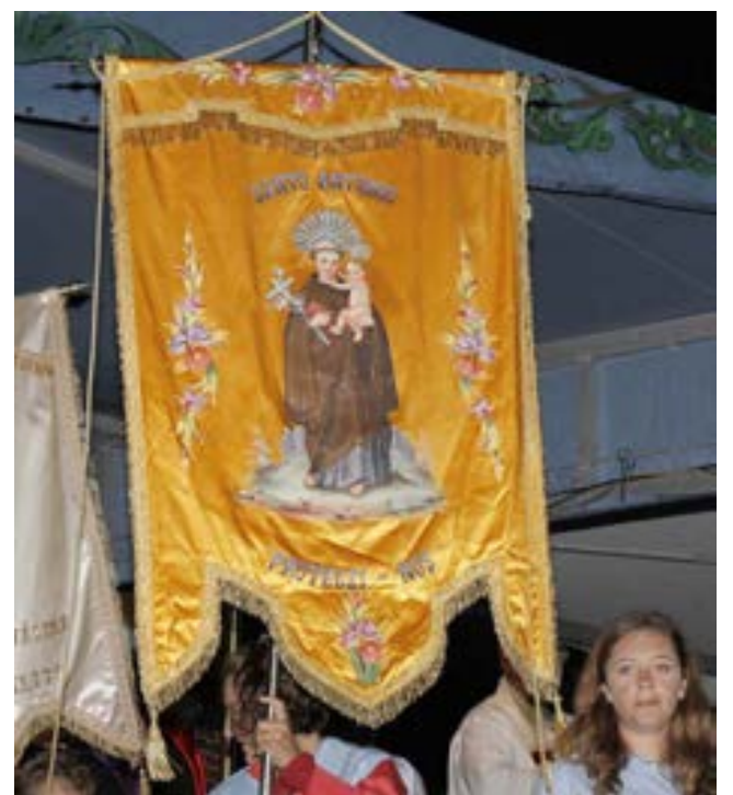
Um dos guiões que se incorporou na procissão de Nossa Senhora de Fátima pelas ruas de Ludlow na noite de domingo perante milhares de pessoas que anualmente ali se deslocam.