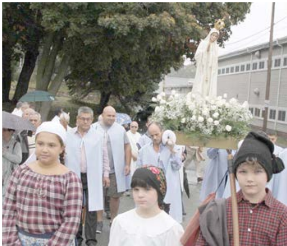
O andor com a imagem de Nossa Senhora de Fátima transportado pelos fiéis, vendo-se em primeiro plano os “Três Pastorinhos” que acompanharam a imagem.