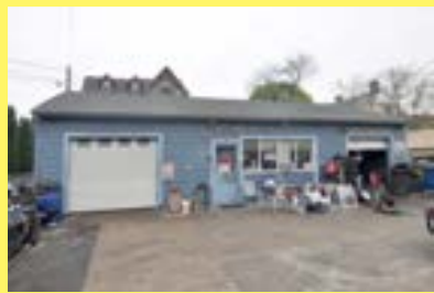
Commercial/Auto Repair CENTRAL FALLS $189.900