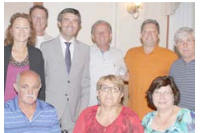
O secretário de Estado das Comunidades com o Brightridge Club