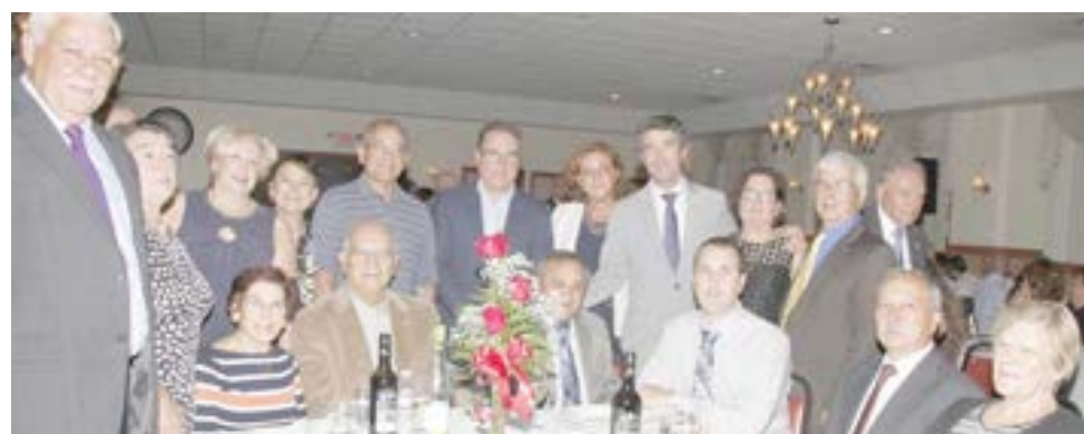
O secretário de Estado das Comunidades com o Clube Social Português