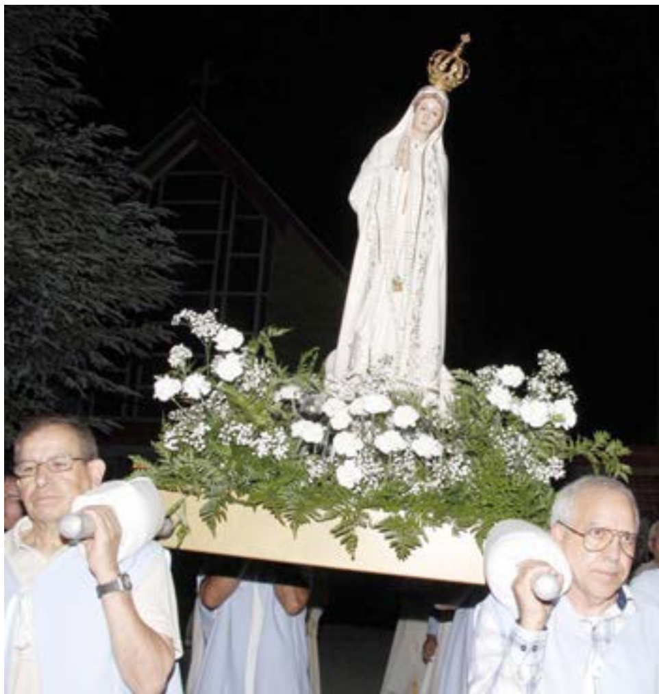
Na noite de quinta-feira teve lugar a procissão de velas que foi muito concorrida pelos fiéis, pelas ruas de Cumberland.