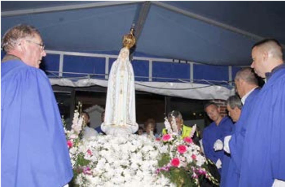
A imagem de Nossa Senhora de Fátima após a chegada à capelinha ladeado pelos homens que transportaram o andor.

A comunidade de Ludlow não sendo muito numerosa, tal como nos dizia o proprietário do restaurante Tony & Penny: “Os portugueses aqui são muito concretizadores. Há cidades com larga percentagem de portugueses e que não dispõem de tantas iniciativas comunitárias, como