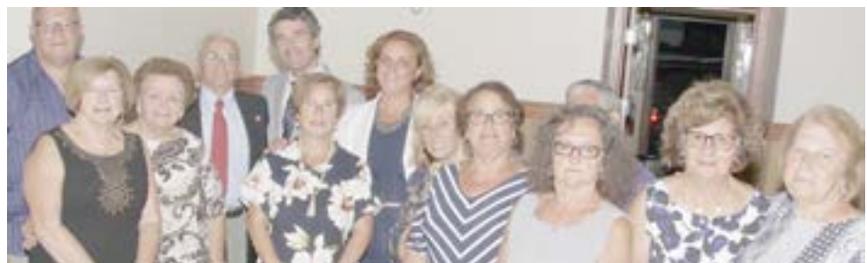
O secretário de Estado das Comunidades com o Phillip Street Hall