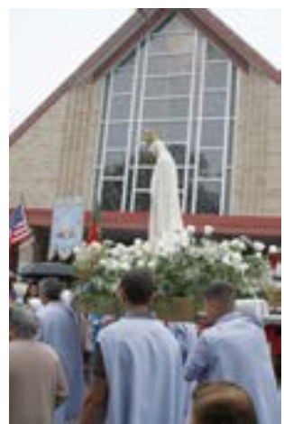
O andor com a imagem de Nossa Senhora de Fátima em frente à igreja do mesmo nome em Cumberland.