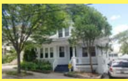
Bungalow EAST SIDE $329.900