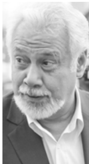
Xanana Gusmão, ministro do Planeamento e Investimento Estratégico de Timor Leste.

Saliente-se ainda que Xanana Gusmão será o orador principal do banquete de gala anual da PALCUS, a ter lugar dia 23 de setembro, em Yonkers, New York.